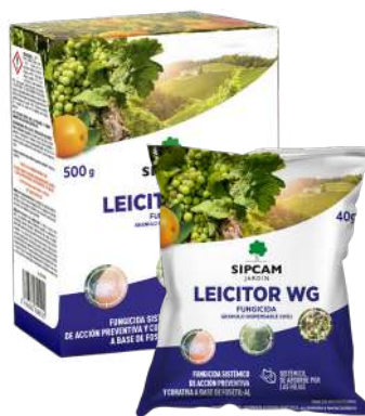
SJ LEICITOR WG fosetil 40g / 500g