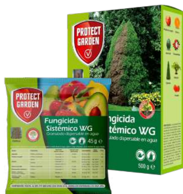
PG FUNGI SIS ALIETTE WG 45g / 500g